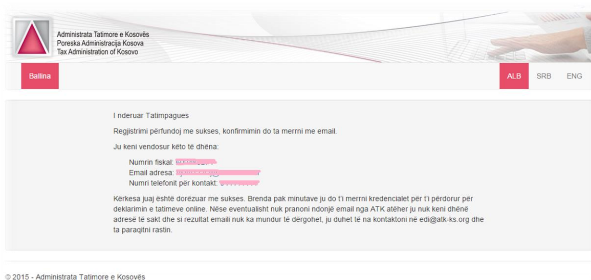
Figura 4: Mesazhi pas regjistrimit të suksesshëm

Në vazhdim janë paraqitur dy skenario, ku tatimpaguesi dështon gjatë regjistrimit: